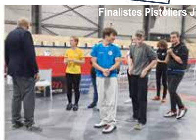
Finalistes Pistolièrs J