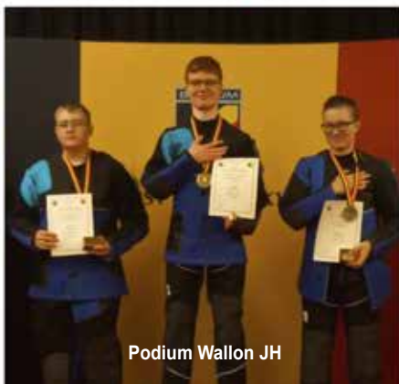
Podium Wallon JH