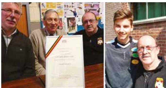
Les pères fondateurs et la relève

Comptant près de 150 membres, ce club possède également une école de tir au pistolet et à la carabine à plomb pour les jeunes de 8 ans à 20 ans.